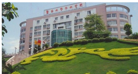
这是暨南大学华文学院办公大楼